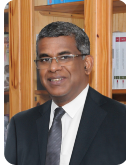
එස් දිසානායක LLM, හිතිඥ

මණ්ඩලයේ සභාපතිනිය වශයෙන් කටයුතු කරන දවුලාගල මහත්මිය ශ්‍රී ලංකා මහ බැංකුවේ නියෝජ්‍ය අධිපතිනියකි. ඇය ශ්‍රී ලංකා මහ බැංකුවේ මූල්‍ය, විගණන, සංචිත කළමනාකරණ, නියාමන සහ අධීක්ෂණ, සාර්ව විවික්ෂණශීලීතා අධ්‍යයන, මානව සම්පත් කළමනාකරණ සහ අවදානම් කළමනාකරණ යන ක්ෂේත්‍රවලට අයත් විවිධ තනතුරුවල වසර 32 කට අධික සේවා කාලයක් සම්පූර්ණ කර ඇත.