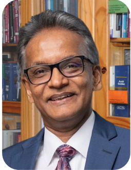
ටී ජේ එස් රාජකාරිය FCA, FCCA, FCMA, CGMA

සභාපති, ව්‍යවස්ථාපිත විගණන ප්‍රමිත කමිටුව