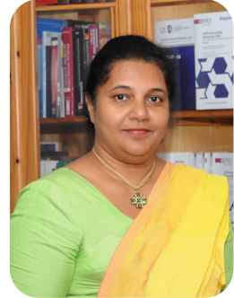
එ අයි මොහොට්ටි FCA, FCMA (UK), CGMA, MBA (Leicester), BBA (Hons.)(Col),

ශ්‍රී ලංකා ගිණුම් සහ විගණන ප්‍රමිති සම්බන්ධ මණ්ඩලයේ (ශ්‍රී.ල.ගි.වි.ප්‍ර.ස.ම.) අධ්‍යක්ෂ ජනරාල්වරිය වන මොහොට්ටි මහත්මිය මූල්‍ය හා ව්‍යාපාර කළමනාකරණය සහ විගණනය පිළිබඳව වසර 35කට අධික පළපුරුද්දක් ලබාගෙන ඇත. ඇය විම කාලයෙන් වසර 23කට අධික කාලයක් ශ්‍රී.ල.ගි.වි.ප්‍ර.ස.ම. යේ මූල්‍ය ප්‍රකාශන පිළියෙළ කරන්නන් ශ්‍රී ලංකා ගිණුම්කරණ ප්‍රමිතීන්ට අනුකූල විම නියාමනය කිරීමේ කටයුතු සහ විහි විගණකවරු විගණන ප්‍රමිතීන්ට අනුකූලව විගණනය කිරීම නියාමනය කිරීමේ කටයුතුවල නිරත වී ඇත. ශ්‍රී.ල.ගි.වි.ප්‍ර.ස.ම. යේ නියාමන කණ්ඩායමේ සාමාජිකාවක වීමට පෙර, ඇය කාසන්ස් සමූහ සමාගමේ සහ අර්න්ස් සහ යං සමාගමේ සේවය කර ඇත.